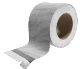
MANICA PLASTER Seite 146