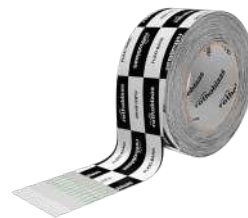
FLEXI BAND Seite 78