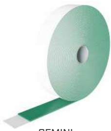
GEMINI Seite 134